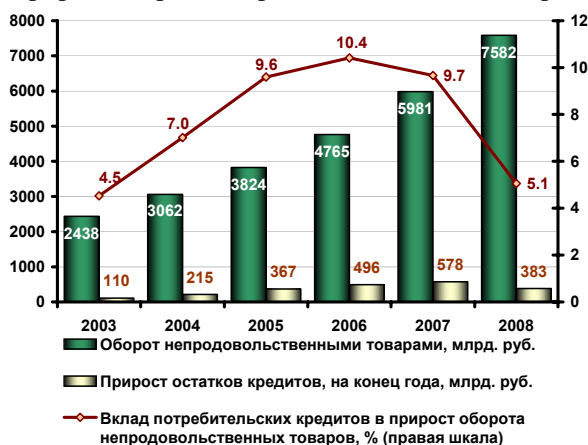
График 8. Вклад потребительских кредитов в прирост оборота непродовольственных товаров